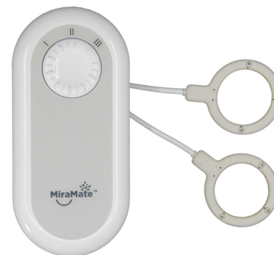
MiraMate Mini Magic

MiraMate Mini Magic est un appareil PEMF compact et portable qui peut réduire efficacement la douleur aiguë et l'inconfort n'importe où et n'importe quand.