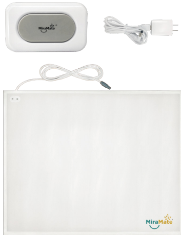
MiraMate Big Magic

Avec le grand tapis PEMF, Big Magic peut couvrir une surface considérable, ce qui vous permet de le placer sur votre chaise ou votre lit et de vous y asseoir ou de vous y allonger. Ce tapis est particulièrement utile pour les personnes qui souffrent d'inconfort au niveau du dos, des jambes ou des hanches.