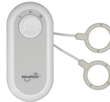
MiraMate Mini Magic

MiraMate Mini Magic ist ein kompaktes und tragbares PEMF-Gerät, das akute Schmerzen und Beschwerden überall und jederzeit wirksam lindern kann.